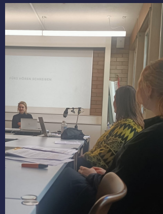
Workshop Storytelling

Das Projekt möchte bei den Studierenden - neben den Kernkompetenzen von Recherche (teils Archivrecherche), Textanalyse sowie Übersetzung von Texten - besonders Medienkompetenzen entwickeln: Storytelling, Drehbuchentwicklung, Einsprechen, Schneiden, Schulung des sachkundigen Einsatzes von Technologien und die Vermittlung möglicher Berufsfelder (Journalismus, Literaturvermittlung, Verlagswesen). Darüber hinaus sind die produzierten Folgen zu weiblichen Autor:innen ein wichtiger Beitrag zur Genderforschung und zur Dekolonisierung der Slavistik (kritische Reflexion der russistischen Perspektive).